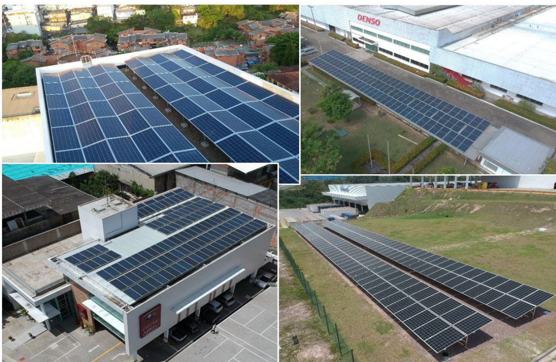
Imagem de algumas de nossas obras executadas em Manaus-AM